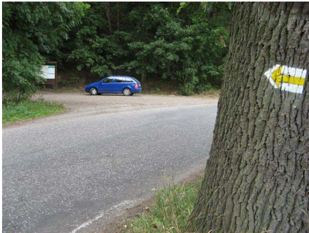
Obr. 1 – odbočka vlevo, ze silnice, za Branžeží