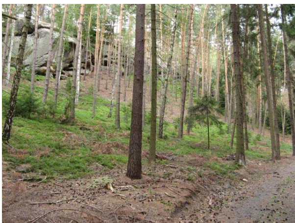
Obr. 5 – cesta bez tur. značení, po cca 150 m uhnout z cesty vlevo do svahu, pod výrazný skalní masiv – lesní pěšinou