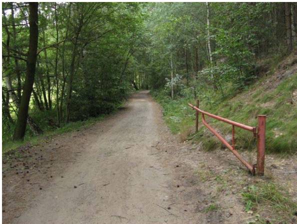
Obr. 3 – cesta po žluté k 1. rozcestí