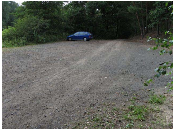
Obr. 2 – parkoviště před závorou