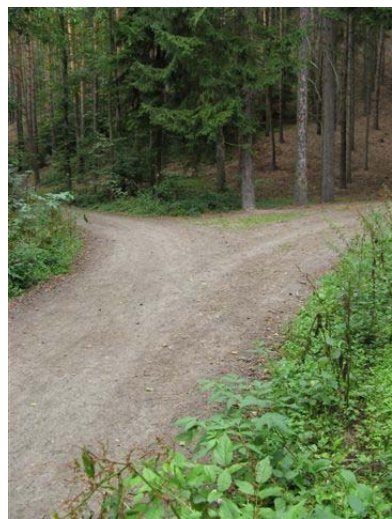
Obr. 4 – rozcestí, uhnout ze žluté, vpravo