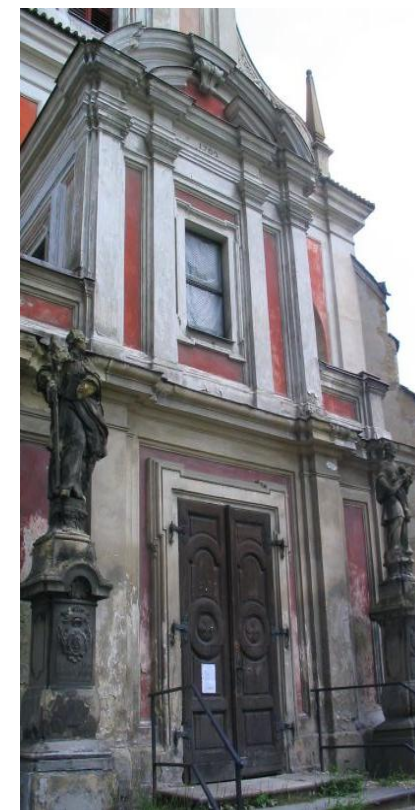
autor: Alena Š. 08/2004, www.hradycy.cz