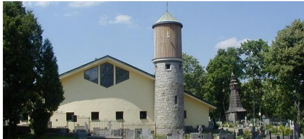
Kostel sv. Mikuláše v Tiché, foto P. A. Forbelsky – www.forbelsky.com

Farní informace – slouží pouze pro vnitřní potřebu – str. 4